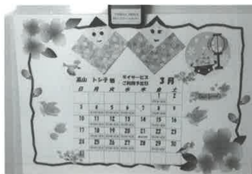
完成したカレンダーです

2月12日～2月14日までの3日間で臨床美術教室を実施しました。臨床美術とは独自のアートプログラムに沿って創作活動を行う事により脳の活性化と認知症状改善を目的として開発されました。