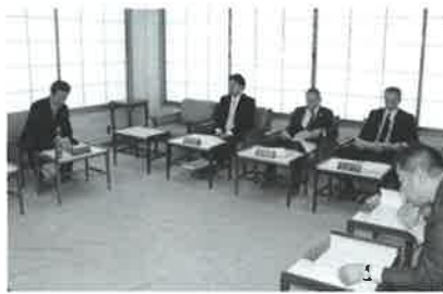
▲理事会は、法人の適正な業務執行の決定と、理事の職務執行の監督責任を担う

平成29年4月より施行された社会福祉法の改正は、法人の地域における役割の明確化と財務の適正な取扱い等、より適正な法人運営が引き続き求められています。 今後もご利用者さんに寄り添ったサービスの提供と、安全な生活を送っていた、だからために努力して参ります。 なお、平成31年度の事業計画は次のとおりです。