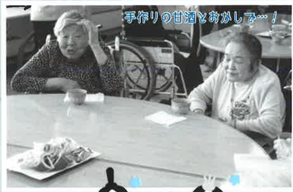
手作りの甘酒とおかしを…！