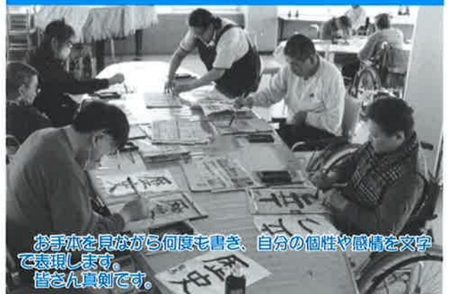
お手本を見ながら何度も書き、自分の個性や感情を文字で表現します。皆さん真剣です。