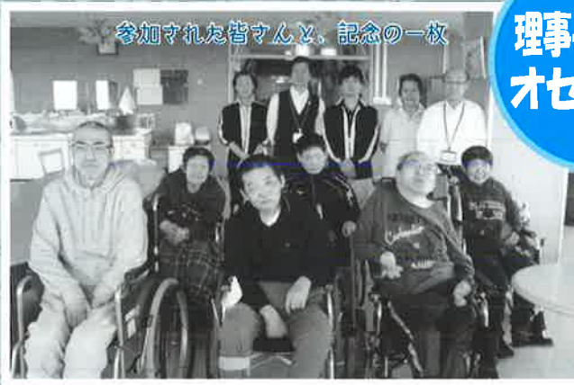
参加された皆さんと、記念の一枚