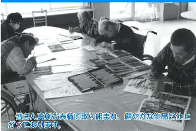
皆さん真剣な表情で取り組み、鮮やかな作品に仕上がっております。