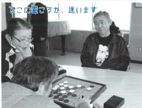
どこに置くのが、迷います