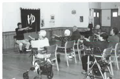
運動不足解消 尿もれ防止体操

ご家庭から一歩踏み出し、のんびり温泉に入り、栄養満点の昼食を摂っていただき、レクリエーションを楽しみ、会話に花を咲かせ、ゆったりとした時間を過ごしてみませんか。