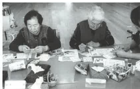
自分の好きなイラストを選んでいきます