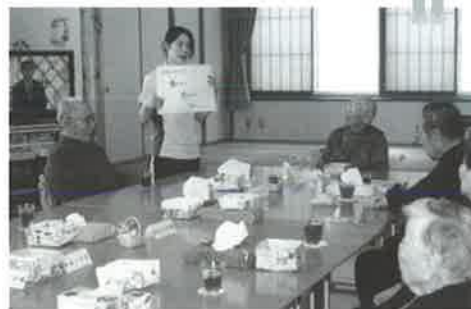
飲み込み、唾液を促進。パ・タ・カ・ラ…