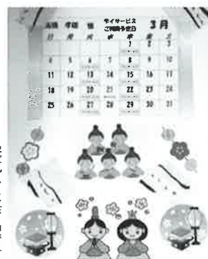
完成した作品です

今回の臨床美術では、ひな祭りを題材としたカレンダー作りを行いました。ご利用者さんは知恵を絞りながらイラスト等を自由な位置に貼り付け、みなさんはそれぞれ世界で一つしかないカレンダーを完成させました。