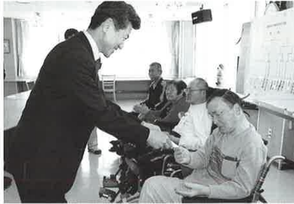
実力者の方々です おめでとうございます