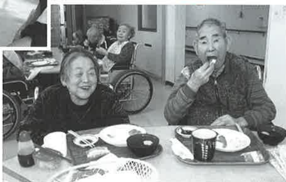
おいしくて、笑顔になります

い」と食べたい気持ちが続出!! 止まらない方が続出した!! 普段食べる機会の少ないにぎり寿司は、ご利用者さんに好評でした。