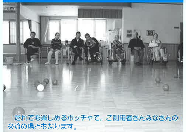
だれでも楽しめるポッチャで、ご利用者さんみなさんの交流の場ともなります。