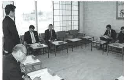
▲理事会は、法人の適正な業務執行の決定と、理事の職務執行の監督責任を担う

当法人は、昭和51年の設立以来42年目を迎え、地域に密着した社会福祉施設運営に努めてまいりました。