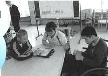
どどこに置いたら良いかな？