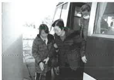
今日一日楽しみましょう！