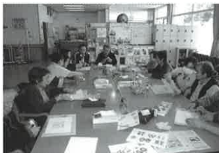
カレンダーの位置を決めています

今回の臨床美術では、ひな祭りを題材としたカレンダー作りを行いました。ご利用者さんは知恵を絞りながらイラスト等を自由な位置に貼り付け、みなさんはそれぞれ世界で一つしかないカレンダーを完成させました。