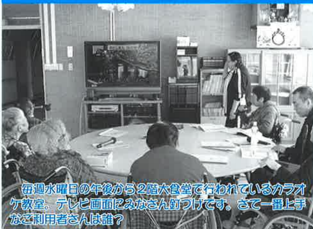
毎週水曜日の午後から2階大食堂で行われているカラオケ教室。テレビ画面をみなさん釘付けです。さて一番上手なご利用者さんは誰?