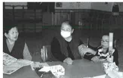
バイタルチェック 体調いかがですか？