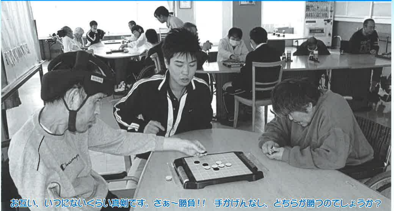
お互い、いつとなくくらい真剣です。さあ～勝負!! 手がげんなし、どちらが勝つのでしょうか?