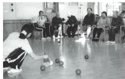
ポッチャ彡集中して時間を忘れず