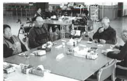
おやつを食べて小休止です

ご家庭から一歩踏み出し、のんびり温泉に入り、栄養満点の昼食とレクリエーション等で楽しく時間を過ごしてみませんか。