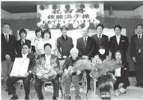
ご家族様はじめ、鹿部町長、佐々木理事長、職員と一緒に

ご家族様からは「皆さんにお祝ひされて、大変嬉しく思います。」と感謝を述べられ、「これからも元気に暮らして長生きしてもらいたい」と温子さんに寄り添い、百歳を喜ばれていました。