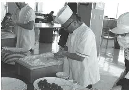
心をこめて握って下さいました