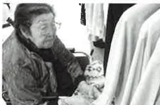
この服の色、私に似合うかしら？ と特養部魚住さん

館のショッピングセンターへやってきた各施設のご利用者さんは、お目当ての品物を求めて2店はしごした方や、商品が多すぎて目移りして大忙しだったと話す方、やっぱりランチはお寿司だと食事を満喫された方など、それぞれの時間を過ごされ、お腹も心も満たされた1日になったのではないのでしょうか。