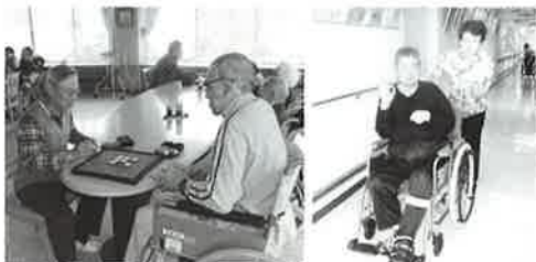
楽しみながら真剣に勝負です「搬送してもらって嬉しいね」とニコリ笑顔