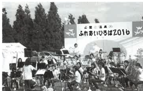
写真は2016年のものです

来る9月3日、ふれあいひろば2017を開催いたします。時間は、午前10時から午後3時までです。皆様のお越しをお待ちしております。