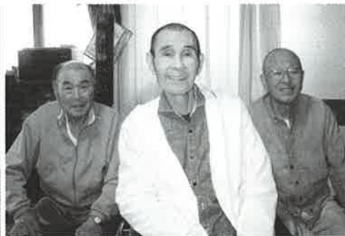
三人揃っていい笑顔