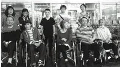
更生部のみなさんで集合写真ハイチーズ