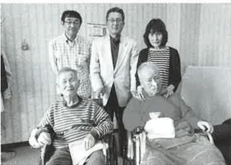
久しぶりの再会 「懐かしく嬉しいですね」と涙がポロリ