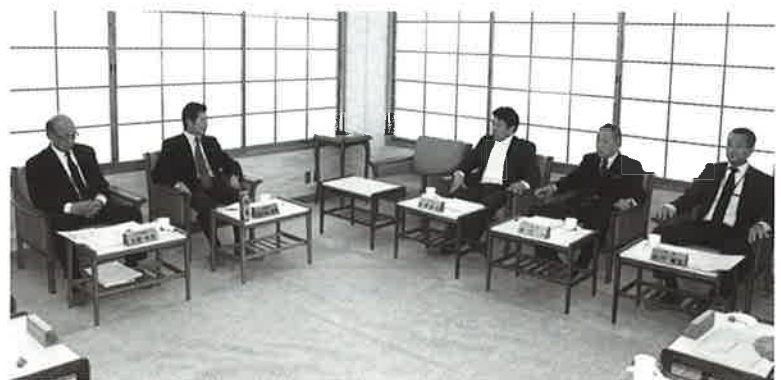
▲業務執行の決定機関が理事会の役割となります

職員の徹底した経費の節減と、施設利用希望者の適切な対応に努めた結果、適切かつ安定した施設運営を行う事が出来た。また、施設建物等の早期補修およ