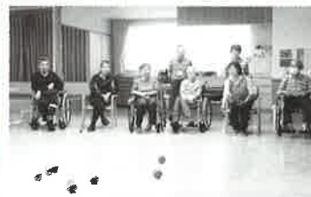
ボランティアの方と一緒に楽しみました