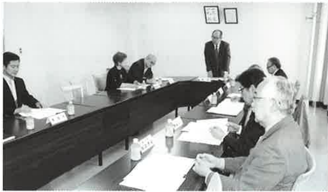
▲運営に係る重要事項の議決機関が評議員会の役目となります

当法人の基本理念「福祉は人なり」のもと3つの基本方針を念頭に、事業計画に基づき施設ご利用者の処遇の充実はもとより、職員の資質向上と、施設特性を生かした地域への貢献を実施した。障害者支援施設は障害者総合支援法に基づき、また、高齢者関連事業所は介護保険法に基づき、個別支援計画の策定やご利用者との契約等を適正に推進するとともに、特別養護部においては社会貢献の一環として、引き続き社会福祉法人によ