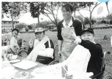
自然に笑顔やピースサインが見られ楽しめました