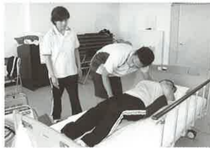
安心安全な介護を目指して

平成29年度新規採用職員2名が介護の基本を講義、実技をおして基礎から学びました。