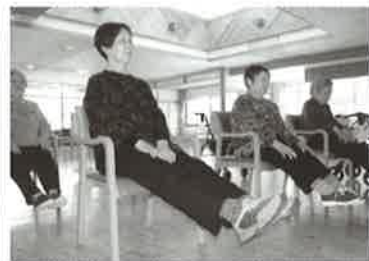
身体機能の維持、回復を図ります