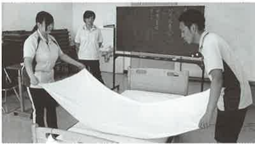
シーツはしっかりシワをのばして