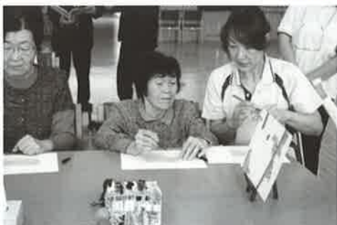
臨床美術：潜在能力を引き出すことにも効果があります

脳を活性化させ、認知症の症状を改善するため開発された臨床美術。作品づくりに上手い、下手は関係ありません。「ほめられる」「共感を得る」ことの喜びを感じながら、自由に前向きに取り組むことが大切です。