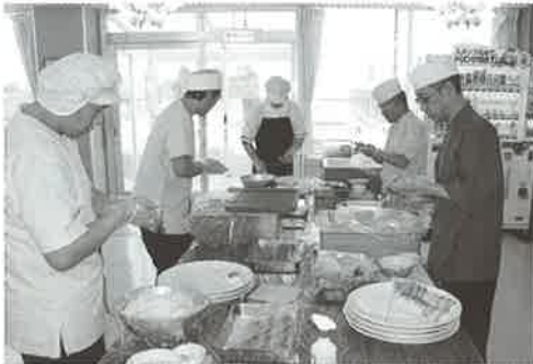
毎年おいしいお寿司をありがとうございます！