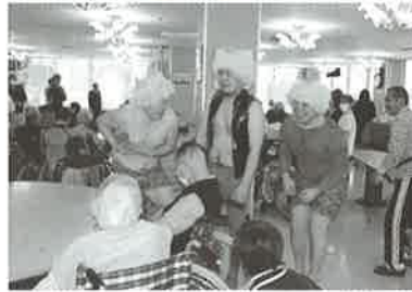
鬼の隙を狙って攻撃するご利用者さん