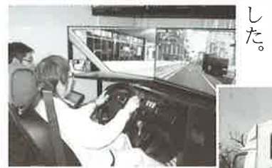
まるで本物の街並み 交通安全教育車はくと号!