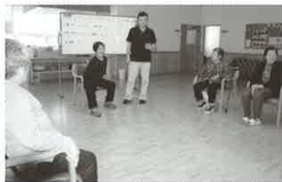
レクリエーション場面 適度な運動の提供をいたします

無料体験・デイサービスをご利用いただき、どんなところなのか、ぜひ一度お試し下さい。ご連絡お待ちしております。