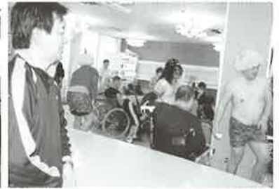
ふくよかな鬼3人組のげけてナイスショット！