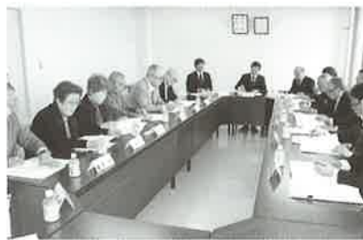
▲諮問機関としての評議員会は、新年度議決機関としての責任を担う

当法人は、今年度で昭和51年の設立以来41年目を迎え、地域に密着した社会福祉施設として努めてまいりました。