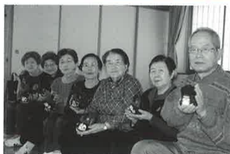
作品を大事に持ち、みんなでハイポーズ！