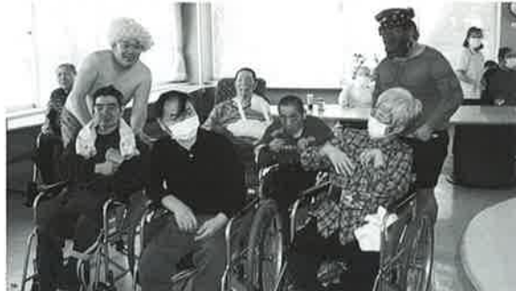
怖い鬼が襲って来た