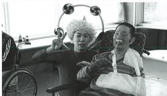
鬼と仲よく？ ツーショット