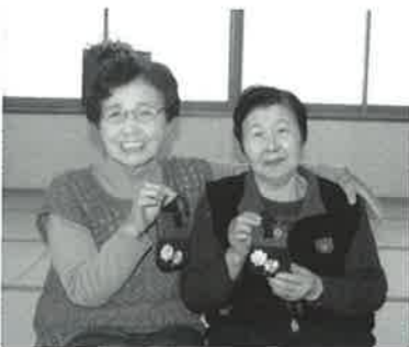
笑顔にあふれています