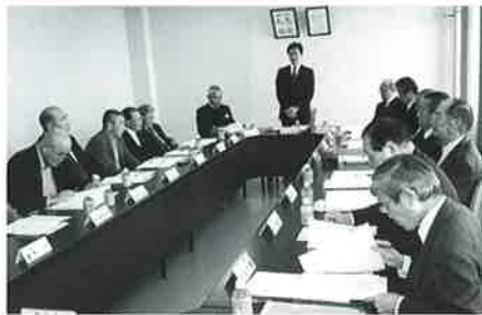
▲新年度事業計画・予算について審議された

4月施行される改正介護保険法による収入面での影響は大きいものの、今後とも、ご利用者さん一人ひとりの心身の状況に合わせたサービスの提供と、生活の場としての日中活動等をより充実させ豊かで安全な生活が送れるよう努力してまいります。 なお、平成27年度の事業計画は次のとおりです。