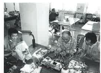
桜を見ながらの手芸

少しずつやっていますよ。年齢のせいで目がショボショボして疲れますけどね」今後は何に挑戦したいですか？「クロスステッチ刺繍以外の手芸もやってみたいけどもっと細かい刺繍もやってみたいな」お花見しながらの作業はいかがですか？「中々おつな物ですよ。早めの花見気分を味わって、もう春だなと毎年楽しみですよ」と話してくれました。