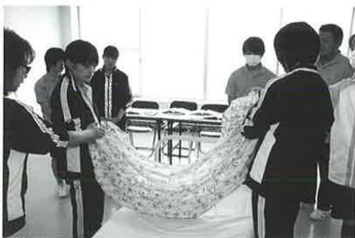
信頼される介護をめざします

●なぜ自分が介護の道に進むことにしたのかという初心を大切にして仕事をしたいと思っています。