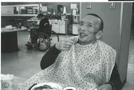
満面の笑顔でバクリ！