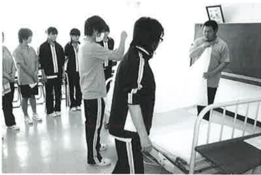
みんなで確認し合いました

平成27年度新規採用職員が3月23日、初出勤となりました。介護の基本を講義、実技をとおして基礎から学びました。