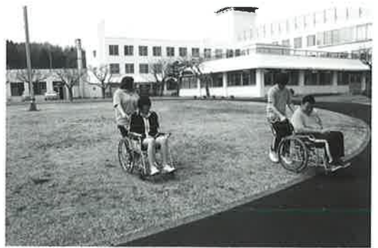
安全な車いすの操作方法を学びました