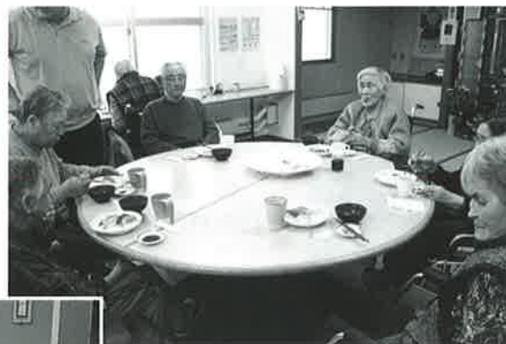
テーブルを囲んで！寿司は最高ですね！！

ます。一貫、二貫……十貫と胃袋の中へ、この時ばかりは食欲旺盛でおいしい寿司に舌鼓を打っていました。