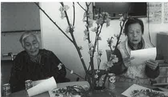
さあ〜みんなで歌いましょう