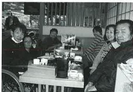
お寿司に大満足です