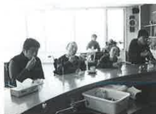
冬でもアイスクリームは人気です

ADL訓練施設「ななかまど喫茶コーナー」が12月から3月までの冬期間閉鎖となるため、この日が最後の利用となりました。