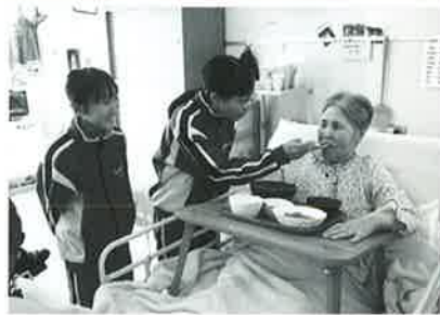
お味はいかがですか？食事介助を体験しました

鹿部中学校1年生が「働くこと」に興味や関心をもってもらうこと、働くことの意義や喜び、働く人々への感謝の心、礼儀作法や言葉遣いを学ぶことを目的に、鹿部町