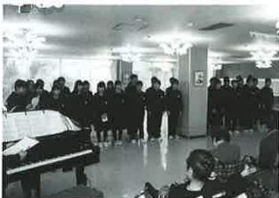
美しいハーモニーが響き渡る！

10月14日、鹿部中学校3年生による合唱交流会が行われました。生徒さん達の素晴らしい歌声にうっとり、聞き入るご利用者さんと職員。更生部