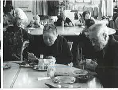
温かいものを温かく、何よりの“ごちそう”

本格的なラーメンに、待ちきれないご利用者さん、スープを一口飲み麵をすすり、「うん、うん」