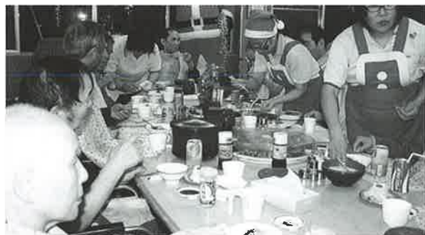
美味しくて食べすぎました