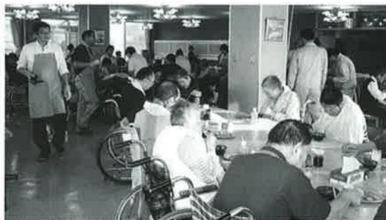
どれを食べても美味しいです