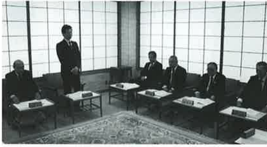
事業の健全な運営について審議される