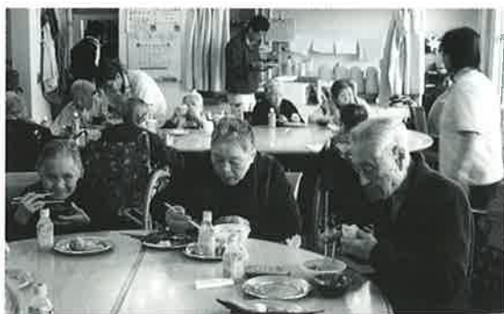
みんなで食べると美味しいね