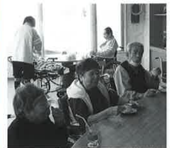
カウンターは満席!

普段から天候が悪い日は2階の大食堂などで開店となるため天候が良い日は「ななかまど」までの短時間ですが外に出て職員とご利用者さんが会話を楽しみながらお散歩