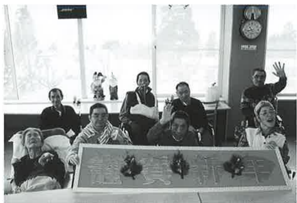
年男、年女のみなさん集合！

今年は無年です。3施設全体で男11名、 女3名、計14名の方が年男年女を迎え、今 年の抱負を何人かのご利用者さんに聞きま した。