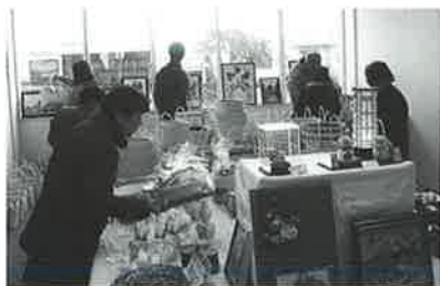
いろいろな作品の良さに感心