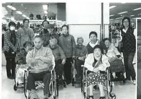
特養部の皆さんで記念の一枚