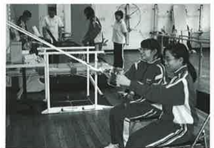
ご利用者さんが行うリハビリも体験！