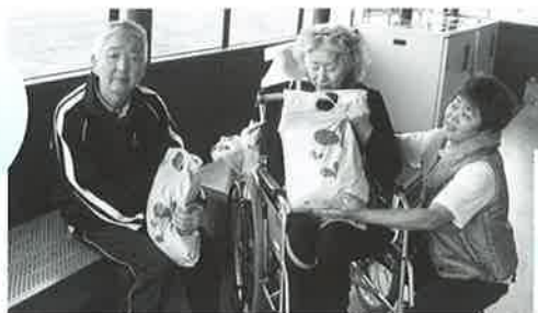
買い物も終わりハイポーズ