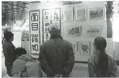
書道や絵画コーナーも足を止めて

文化の日、鹿部町主催により中央公民館で文化祭が行われ、当施設も参加しました。ご利用者さんが毎日作業訓練の一環として精魂込めて作られた味わいのある作品が多く出品され、町民の方も興味深く手にとりそして購入していただきました。今年も日中活