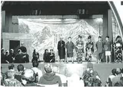
すばらしい名演技です