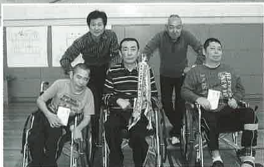
理事長と優勝チームおめでとうございます!!