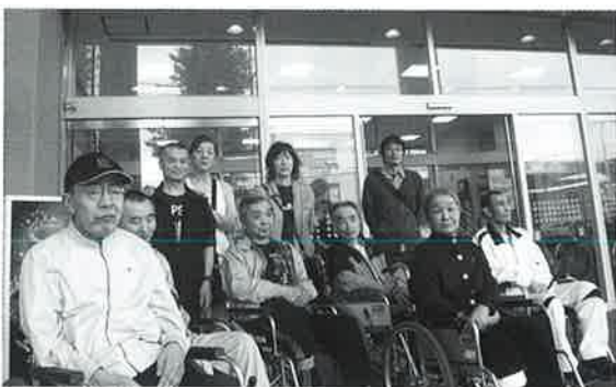
更生部、参加者7名で ハイポーズ!