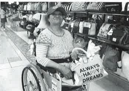
かわいいバッグ 似合ってますね!