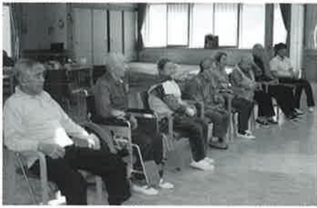
レクリエーション、ポッチャゲーム場面です

デイサービスセンターでは、ご家庭で生活されている方（要介護認定を受けている方）に入浴、食事の提供、健康状態の確認、体操・レクリエーションなどを行っております。また、お花見やクリスマスパーティーの他、森町ショッピングや七飯プールの釣りなどの楽しい行事も行っています。ご家庭で生活を続けながら、日中デイサービスセンターに通っていたことで、健康の増進や孤独感の解消を図ります。