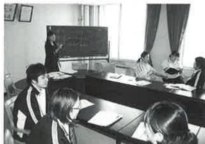
グループにわかれての研修!

4月17日と5月21日にチームリーダー職員研修を行い、社会福祉におけるコンプライアンス（法令遵守）のカテゴリーで「職員が守るべきコンプライアンスの理解」、「虐待防止に向けた取り組み」、「モラルハラスメントの防止により風通しの良い職場風土を築く」をテーマに、福祉施設がコンプライアンスを重視するのはなぜか、今後法令を遵守するために心がけることは何か、など考えました。