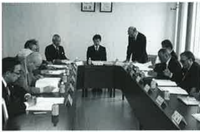
▲収支決算関係および施設運営の公共性について審議された - 評議員会 -

介護・医療・リハビリテーション等において適切なサービス提供をすることも、生活活動支援の充実を図り、明るく、楽しく、潤いある生活が送られる様に支援をした。また、「虐待防止・権利擁護委員会」「事故対策委員会」「リスクマネジメント委員会」「感染症対策委員会」「個人情報保護委員会」「苦情処理委員会」