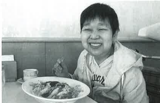
こんなにいっぱい食べられるかしら〜!?