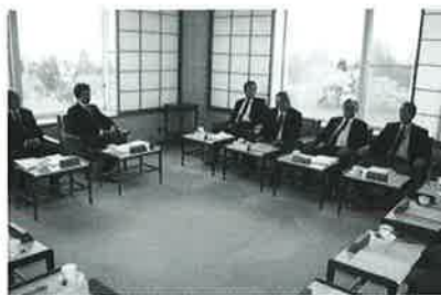
▲より適正な運営をめざして審議が行われた - 理事会 -

遇実施要領等が記載されている「施設運営の手引」や当法人作成の「介助・介護のためのハンドブック」を職員研修及び自己研修に利用させるとともに、職場内研修、現任研修の実施をはじめ介護福祉士など各種資格取得の奨励及び道内外研修会参加を積極的に実施し、職員の処遇向上に努めるとともに利用者処遇向上にも充分反映されるように配慮をした。