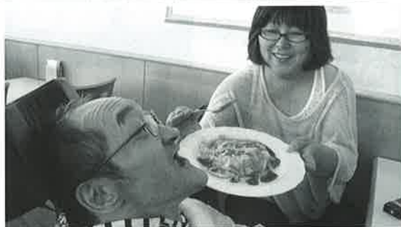
ん〜美味しい大満足!!