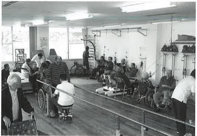
みなさん真剣に取り組んでいます

病気、けが、高齢などが原因で運動機能が低下した状態の方々に運動機能の改善または、低下防止を目的においでいただいております。ここでは一人ひとり個別メニューで疲れない程度のリハビリを行います。中には、昔話に花が咲く方もおり、わきあいあいとした雰囲気の中で皆さん真剣にリハビリに励んでおられます。