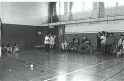
「がんばって」の声援と笑顔があふれていました

初めに、運動会でも披露したという、よさこいを元氣いっぱい踊ってくれました。その後、ご利用者さんと混合チームを作り、ポッチャ交流が始まりました。どのチームも「がんばって」の声援があつて、相手のことを思いやる気持ちがあり、とても良い交流ができました。