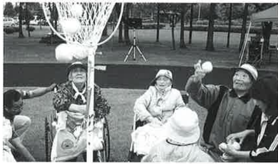
特養部のみなさんも 真剣に玉入れに夢中です