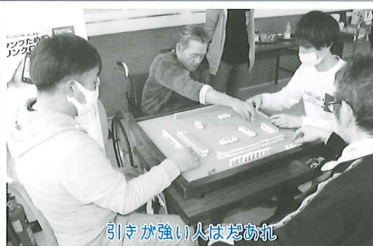
引きが強い人はだあれ