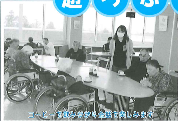
コーヒーを飲みながら会話を楽しまます