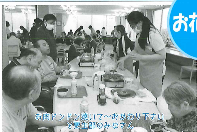
お肉ドンドン焼いて～おかわり下さい と更生部のみなさん