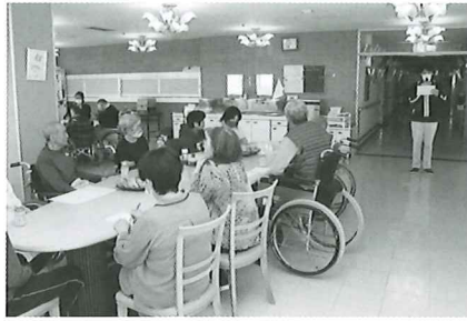
しっかりとお話を聞いています！