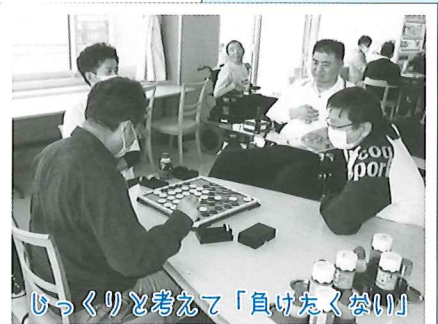
じっくりと考えて「負けたくない」