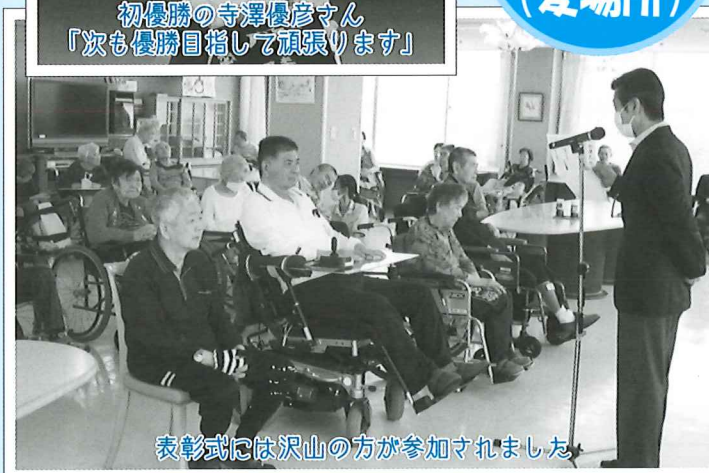
表彰式には沢山の方が参加されました