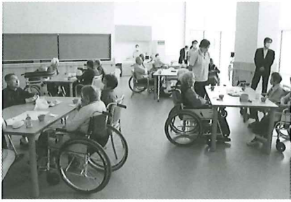
お茶、お菓子を食べながら！

4月14日、春の懇話会が行われました。三施設それぞれのご利用者さんから新年度へのご要望がたくさん出されました。これからも職員一同今以上にご利用者さんが安心して快適な生活ができますよう努力してまいります。