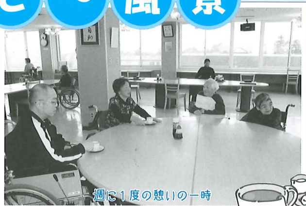
週に1度の憩いの一時