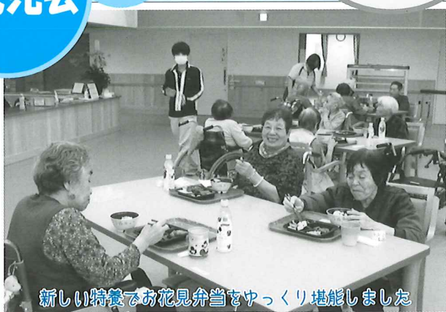
新しい特養でお花見弁当をゆっくり堪能しました