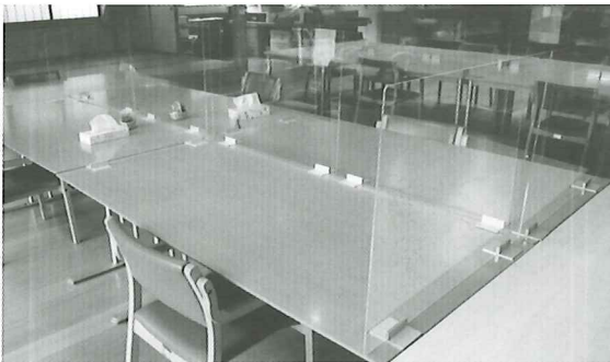
全席アクリル板設置

この度、新型コロナウイルス感染症予防対策としてしばらく営業を休止している中、感染対策を強化してまいりました。広いテーブルを設置する事によりソーシャルディスタンスの徹底、テーブルの前後・左右にアクリル板を設置することで飛沫防止、また、電動式噴霧器を使い館内と送迎車等の消毒を毎日行っております。いままで以上に感染対策をしておりますので安心してご利用ください。