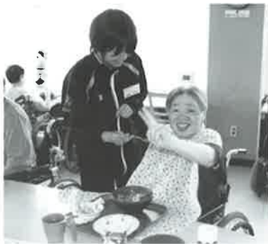
食事介助の体験をしました