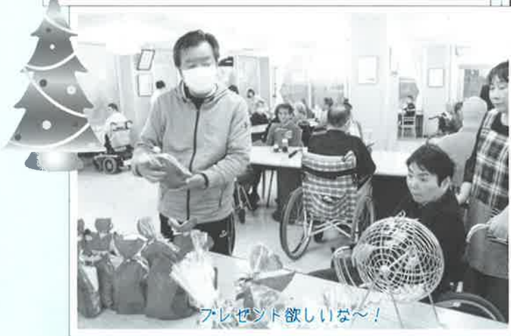
プレゼント欲しいな～！