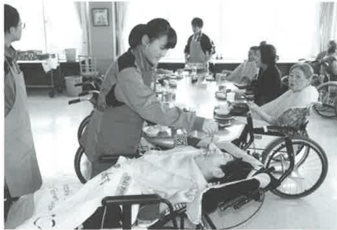
食事介助でご利用者さんも喜んでます

「渡島リハビリ内の見学や給食時のお手伝いをさせていただいたり貴重なお話をたくさん聞かせていただいたりと、とても勉強になりました。」