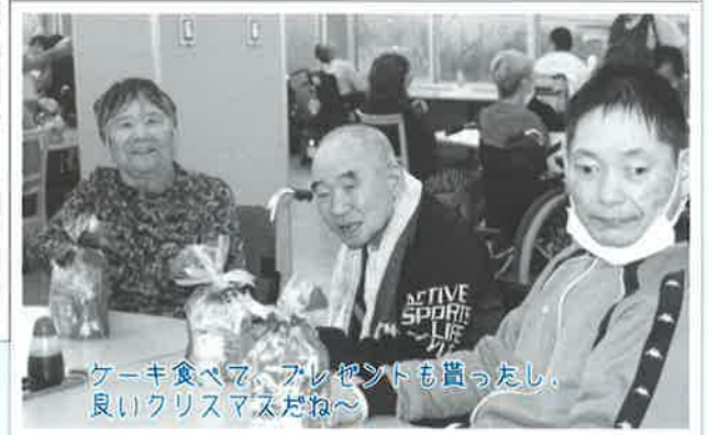
ケーキ食べて、プレゼントも貰ったし、 良いクリスマスだね～