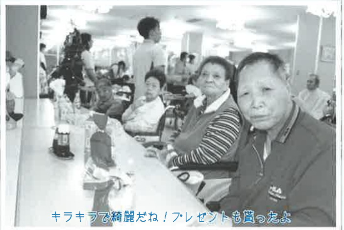
キラキラで綺麗だね！プレゼントも貰ったよ