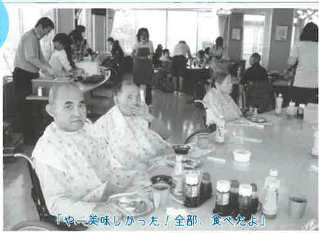
「やー美味しかった！全部、食べたよ」