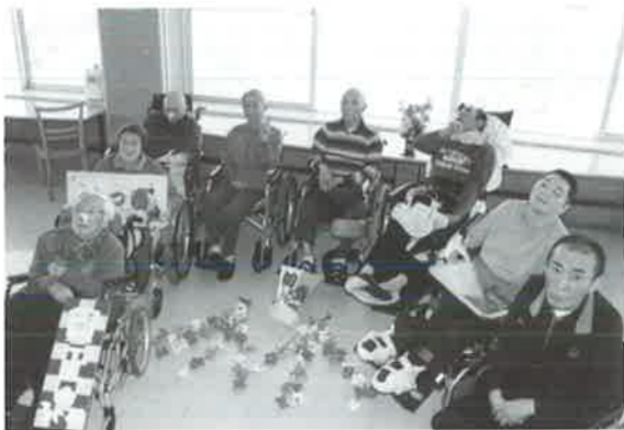
子年生まれの皆さんです

今年の子年です。3施設全体で男性3名、女性5名の計8名の方が年男・年女を迎え、今年の抱負、願いを語っていただきました。