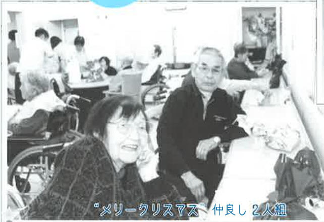
“メリークリスマス” 仲よし 2人組