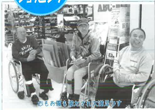
心もお腹も満たされ大満足です