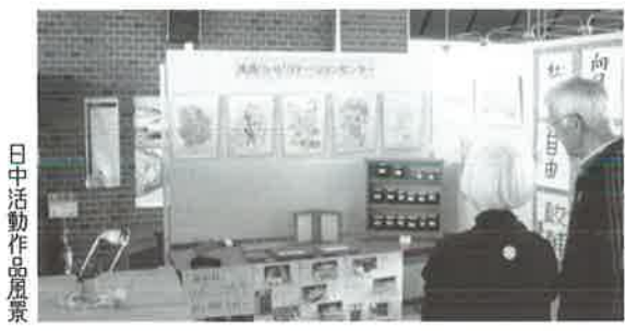
日中活動作品風景

11月3日、鹿部町文化祭が中央公民館で行われ、当施設も参加し、ご利用者さんの作り上げた素敵な作品を、会場にこられた町民の皆さまに、手にとって見ていただきました。また、日中活動での各作品もご覧になっていただきました。