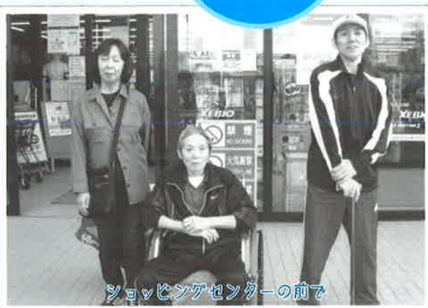
ショッピングセンターの前で