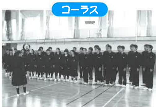
美しいハーモニーでした