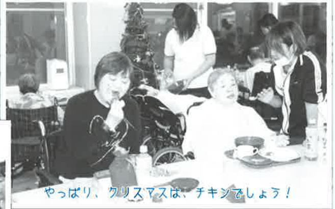
やっぱり、クリスマスは、チキンでしょう！