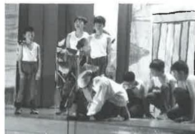
迫真の演技に感動！

ご利用者さん、職員も感動で涙する人もおりました。6年生の皆さん、感動をありがとうございました。