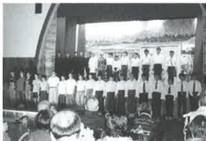
6年生の皆さん ありがとうございます！

10月30日鹿部小学校6年生の皆さんが学芸会で披露した劇「お母さんの木」を演じてくれました。