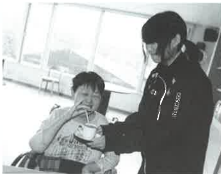
喫茶コーナーでコーヒーを飲むお手伝いをしました