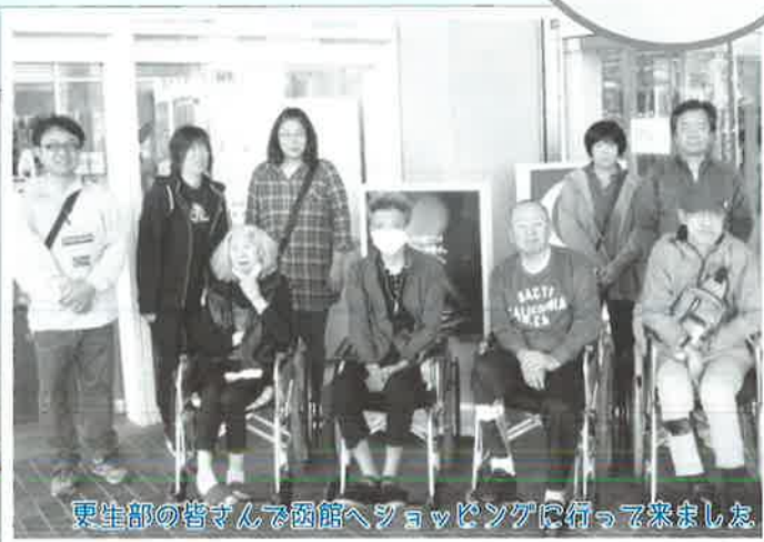
更生部の皆さんで函館へショッピングに行ってきた