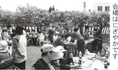
会場はにぎやかです