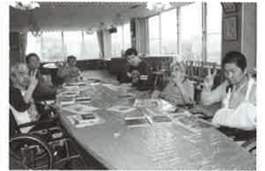
作品制作中 みんなでハイチーズ!