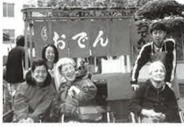
桜と私達、どっちがきれい？