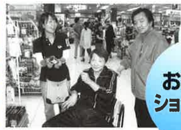
次どこにいきましょうか？