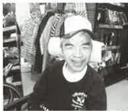
この帽子似合うでしょ?!

ほしい物は事前に取りストアップ済み、まずはCDショップと電気店へ行き、お目当ての商売をゲット! その後はデイスカウントショップでショッピング。昼食はもちろん、大好きなお寿司です。この日一日、限られた時間ではありましたが、十分満喫されたようです。