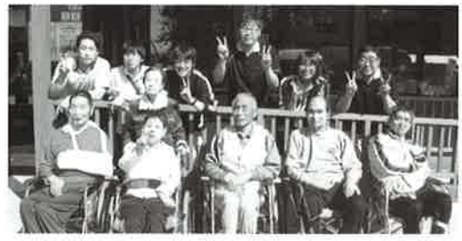
この日はいい天気でした

物産館には鹿部で採れた沢山の魚介類や、特産品であるタラコなどの水産加工品が売られており、どれも美味しそう。名物の温泉を利用した