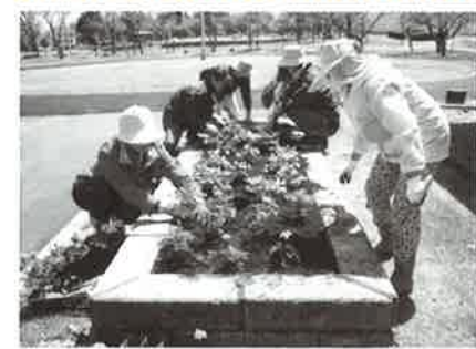
和気あいあいとした雰囲気です