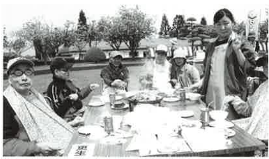
御家族と一緒に参加