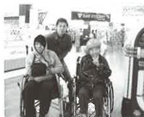
欲しい物は見つかりましたか?

ほしい物は事前に取りストアップ済み、まずはCDショップと電気店へ行き、お目当ての商売をゲット! その後はデイスカウントショップでショッピング。昼食はもちろん、大好きなお寿司です。この日一日、限られた時間ではありましたが、十分満喫されたようです。