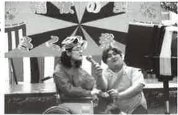
ちよつと恥ずかしいけど...歌います!