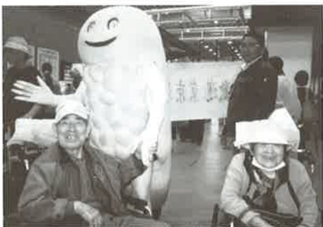
ずーしーほつきーと会いました