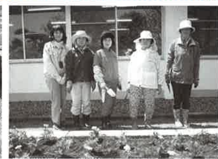
鹿部町内会、福祉部長連絡協議会の皆さん

今年度は鹿部町内会福祉部長連絡協議会の方々に、3つの花壇にサルビア、ダリアなど色とりどりの花々が一つ一つ丁寧に植えられました。皆様のご協力により、たくさんの方々が植えられ、花壇が花いっぱい絵顔いっぱい埋め尽くされました。