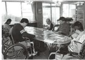
みなさん真剣です

たり絵を描いたり、みなさんとても熱心でどの参加者も真剣な眼差しと笑顔でいっぱいでした。