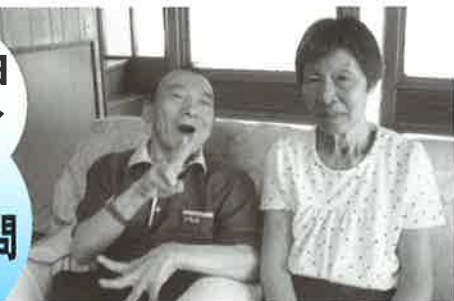
お義姉さんと記念の一枚