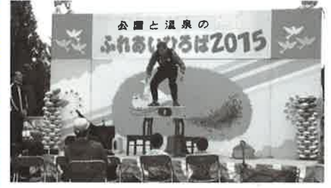
写真は2015年のものです

来る9月4日、当センターにおいて、ふれあいひろば2016を開催いたします。時間は、午前10時から午後3時までです。皆様のお越しをお待ちしております。